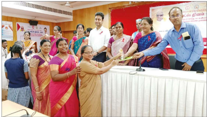
விழுப்புரம் மாவட்டம் கலெக்டர் அலுவலக கூட்டாங்கில் தமிழ்நாடு மாநில எம்ப்ளூ கட்டுப்பாடுசங்கம்மாவட்ட எம்ப்ளூகட்டுப்பாட்டுஅலுவலகார்பிஸ்உலகஎம்ப்ளூ...