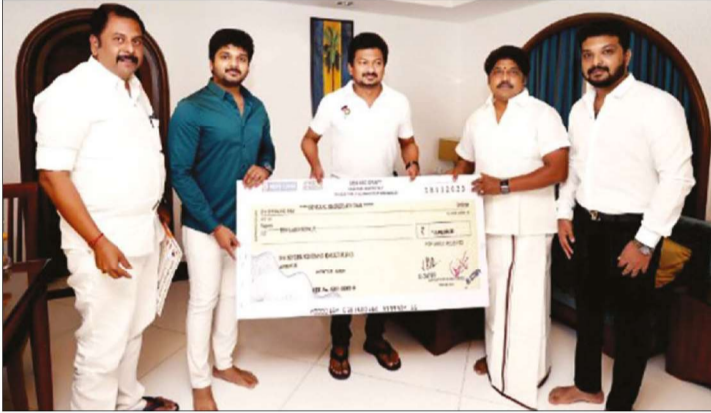
மேன்மைக்கு எரியும் ஆட்சியர் அவர்கள் கூலூர் அதி.மு. 2023

சென்னை, 07, டிசு: பெண்களின் தொழில்முனைவு மற்றும் தன்னம்பிக்கையை ஆதரிப்பதை நோக்கமாகக் கொண்ட ஒரு முன்முயற்சியில், மேக்மைட்ரிப் உடன் இணைந்து, நிதி ஆயோக்கின் கீழ் அடைக்கப்பட்ட மகளிர் தொழில்முனைவோர் தளம் (WEP) 'புரொஜெக்ட் மைட்ரி' தொடங்கியது.